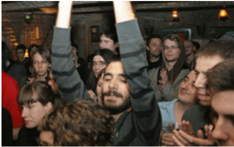
Junge Menschen in Subotica beim Tanzen in einem Café.