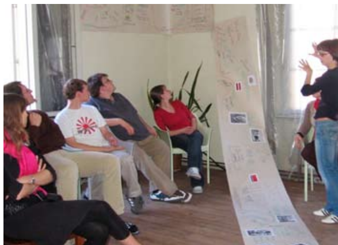
First Aid Toolkit Photo: Seminar in Lettland

Alle anderen Unteraktionen sind wegen der indirekten Teilnahme der Schweiz am Programm bei uns noch nicht erprobt.